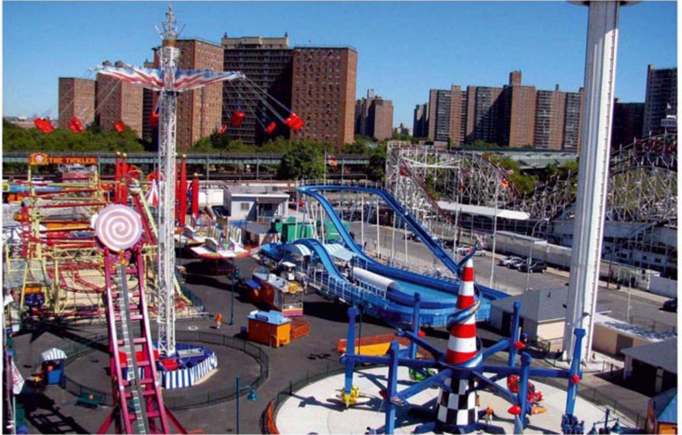
۳-۱۲) نمونه‌های اجرا شده