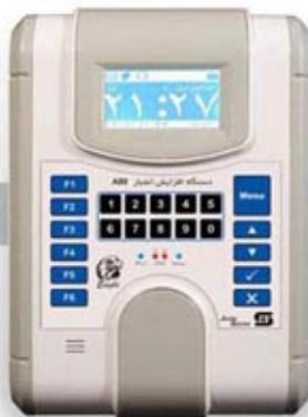
دستگاه افزایش اعتبار